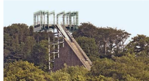
Gute Aussicht vom Messingberg in der Erlebniswelt Steinzeichen

Das Wesergebirge ist ein Höhenzug, der zum Weserbergland zählt. Es ist etwa 23 Kilometer lang und 1,5 Kilometer schmal. Es besteht aus Kalkstein in härteren und weicheren Schichten. Da die Schichten schräg liegen, haben sich aufsteigende Kämme und Stufen in der Landschaft geformt. Querverwerfungen in den Kalksteinschichten haben Spalten, Klüfte und Kuppen gebildet, aus denen das charakteristische zackenförmige Profil entstanden ist.